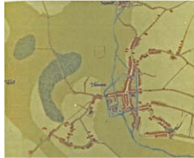
Kaart Van Deventer circa 1540. Tussen de stadsbebouwing en Binderen is links van de weg, middels twee kleine stippen, het "Nieuwe Gasthuis" te ontwaren.

De heilkunst stond vóór de zestiende eeuw in gering aanzien. Het was toevertrouwd aan heelmesters en chirurgijns die in het gasthuis sneden in zweren en ontstekingen, gebroken ledematen spalkten, maar ook amputaties en aderlatingen verrichtten. De (geneeskundige) handelingen werden enkel door mannen uitgevoerd. In 1421 was een wet uitgevaardigd die vrouwen belemmerde de geneeskunst te bedrijven. Vanaf de zestiende eeuw werd hierop een uitzondering gemaakt voor vrouwen die zich bekwaamden in de behandeling van borstaandoeningen. Er is een lange periode geweest dat de geneeskunde van de lijst der wetenschappen was afgevoerd en aan Hogescholen niet meer onderwezen mocht worden. Daarom werd de chirurgie vaak door lagere bedienden of barbiers uitgevoerd. In de veertiende en vijftiende eeuw waren de namen barbier, wondheler en chirurgijn dan