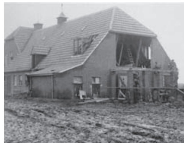
De verkeersleiding nestelde zich achter in de boerderij van de familie Peeters. De stal werd daarvoor verbouwd en van een balkon voorzien.

gebruikt was door Auster-verbindingstoestellen van 659 Squadron. Dat waren lichte observatie-toestellen die gedurende de Tweede Wereldoorlog werden gebouwd voor de strijdkrachten van Groot-Brittannië en Canada en die nauw samenwerkten met legereenheden van de artillerie. De 13 Airfield Construction Group kreeg opdracht om op de gevonden locatie bij Helmond een vliegveld aan te leggen voor de kleinere vliegtuigen. Een 350 ha groot all weather-vliegveld met één start- en landingsbaan. Dit terrein dat door de verkenners van de Britten werd gevonden lag tegenover missiehuis Christus Koning, ter hoogte van de huidige recreatieplas Berkendonk. Het gebied dat bij ons bekend is onder de naam Rijpelberg en dat toen nog tot de gemeente Bakel-Milheeze behoorde.