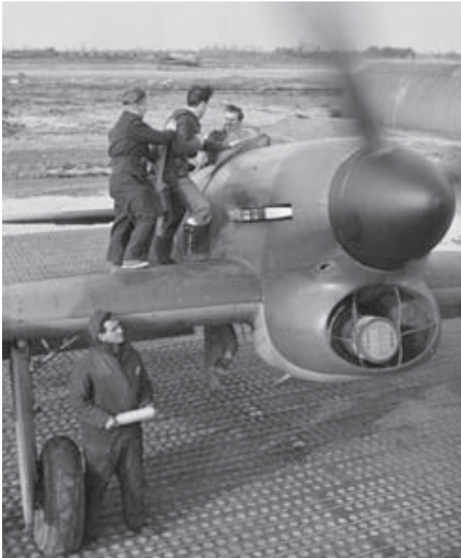
Grondpersoneel treft voorbereidingen voor het start van een Typhoon jachtbommenwerper op het vliegveld B-86.

Button DFC (Distinguished Flying Cross), die later vermoedelijk bij zijn eerste landing op dit vliegveld is verongelukt. Het vliegend personeel, circa 100 piloten, werd ondergebracht in het missiehuis Christus Koning, vlakbij het vliegveld. De Typhoon was een formidabel aanvalswapen dankzij de zeer zware bewapening met 4 tweecentimeter kanonnen en een alternatieve uitrusting met