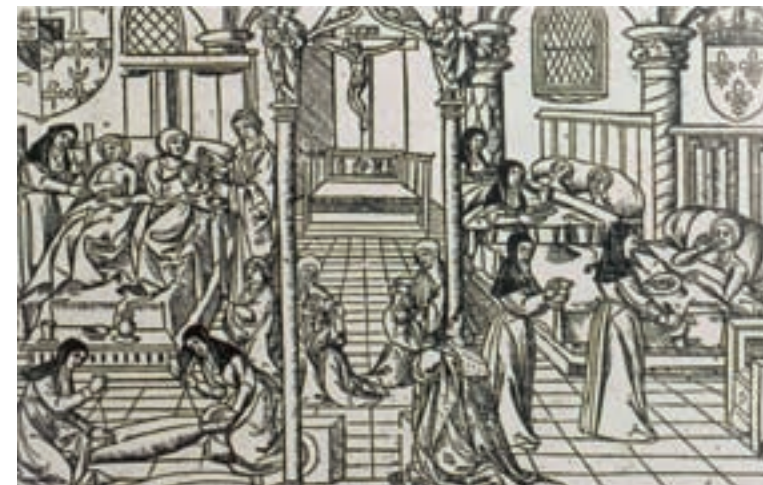
Tekening van een ziekenzaal in de zestiende eeuw. Op de voorgrond wordt een overledene voor de ter aarde bestelling in een linnen zak ingenaaid. (collectie RHCe)

Voor onderhoud en verpleging van logés en zieken ontvingen de gasthuismeesters onder andere: periodiek acht ponden brood, een kwart smout (vet), een pond kaarsen en jaarlijks nog achttien karren turf, door de pachters van de armenhoeven te bezorgen. Wanneer zieken ter verpleging werden opgenomen, moesten de gasthuismeesters die naar hun beste vermogen verzorgen. Ter vergoeding mochten zij, voor de gehele ziekteperiode, twaalf stuivers per patiënt rekenen. Voor de kost mocht, indien het arme personen waren, een matige rekening bij de Heilige Geestmeesters worden ingediend. De meer gegoede burgers moesten door de familie zelf van drinken en maaltijden worden voorzien dan wel hiervoor een gepaste vergoeding betalen. In geval van overlijden waren de gasthuismeesters verantwoordelijk voor de begrafenis, ze mochten de kleding van de overledene evenwel als genoegdoening