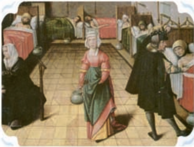
Tekening van een vroegere ziekenzaal. Ontleend aan "Ach Lieve Tijd"

stond ter hoogte van de huidige Sint Willibrordstraat. Het bestond uit twee panden, het ene werd bewoond door de gasthuismeesters, het andere was bestemd voor de verpleegden. Vandaar dat men sprak over het grote en het kleine gasthuis. Het wordt in diverse stukken ook als het 'nieuwe gasthuis' aangeduid, Mogelijk is het ter voorkoming van besmetting ver van de toenmalige bebouwing gehouden.