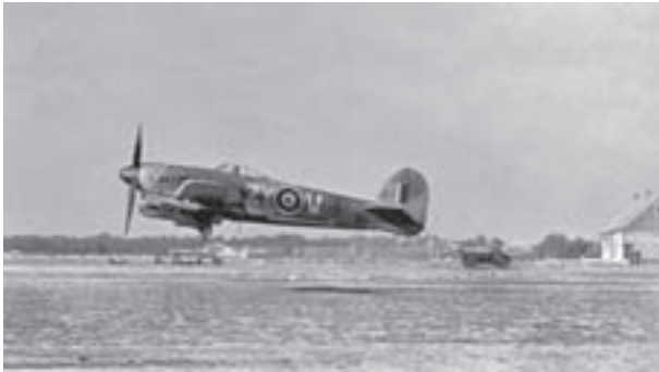
Een Typhoon stijgt op vanaf B86 Helmond in maart 1945.