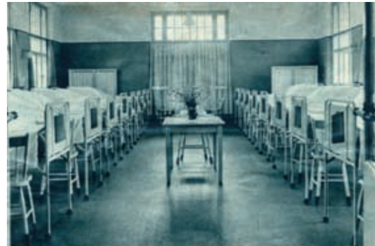
Afbeelding van een vroegere ziekenzaal.

Aan het begin van de zeventiende eeuw verkeerde het gasthuis in een erbarmelijke staat. Het gebouw was zo slecht dat één wand volledig was ingestort. Er werden nog wel enkele kleine reparaties uitgevoerd maar voor de verpleging van zieken was het totaal onbruikbaar geworden. In het midden van de eeuw wordt het nog genoemd als: “ Daer d’aermen siecken ontfangen ende ghetractert worden ”, maar in de daarop volgende eeuw diende het enkel nog, al dan niet kosteloos, tot onderkomen voor arme gezinnen. Zieken en hulpbehoevenden, ook die van