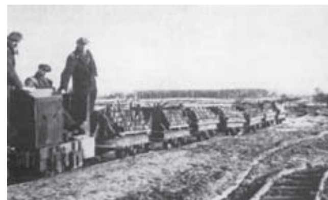
Voor de aanleg van het vliegveld werd gebruik gemaakt van een Decauville smalspoortreintje.